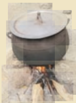
Feu «trois pierres»

80 % de la population africaine non urbaine utilise le «feu de bois» ou «feu trois pierres» pour cuisiner. Ce mode de cuisson réclame 15 Kg de bois par jour et par famille. En plus d'un transport lourd et fastidieux du bois par les femmes du village, ce mode de consommation engendre une déforestation progressive de la forêt africaine et une émission de CO2 importante.