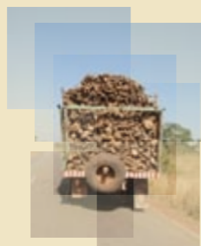
Camion acheminant le bois